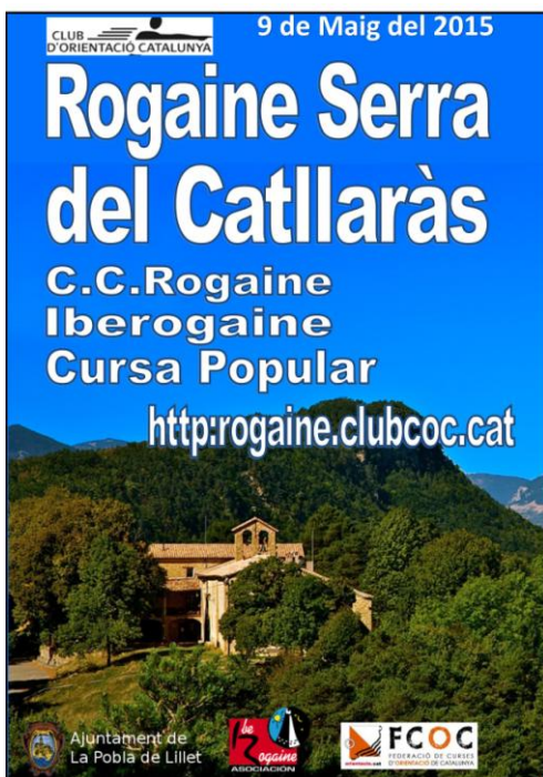
Cartell Rogaine de Catllaràs